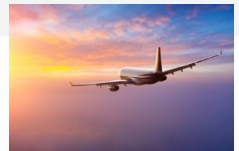
フライト/イメージ