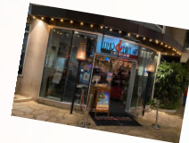
レストラン外観/イメージ

※ご予約時に夕食開始時間を承ります ※送迎はついておりません(ホテルから徒歩10分)