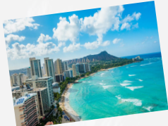
ワイキキビーチ/イメージ

ご自身にて搭乗手続き、出国手続き 21:35 JAL798 中部国際空港から空路、ホノルルへ